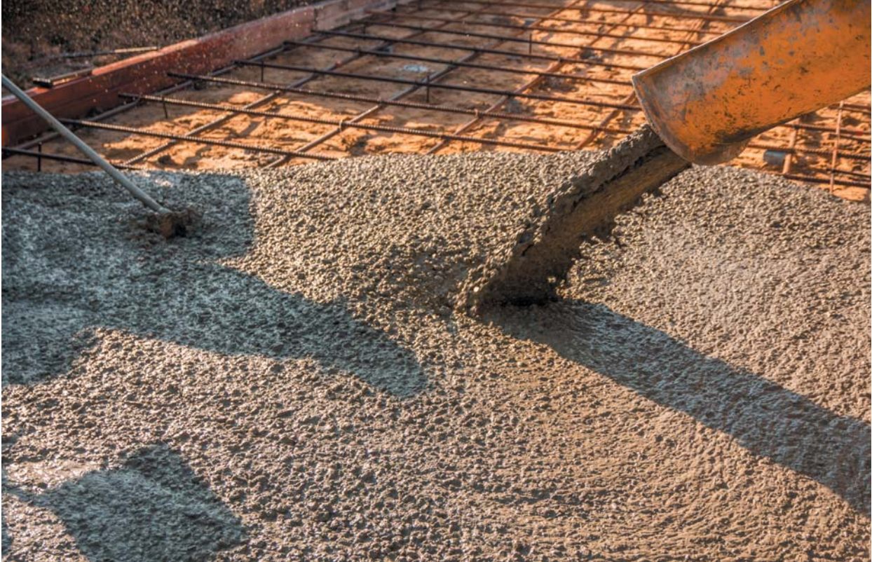
La transformación digital permitirá saber de manera anticipada la resistencia del hormigón que estamos vertiendo hoy.

un personal de seguridad mínimo en las plantas. De manera más concreta, esta situación va a requerir de una adecuación rápida y un pequeño comisionamiento muy bien programado, observando y cumpliendo las restricciones en el flujo de personal hacia las fábricas que los gobiernos impondrán para nuevos protocolos de movilidad y de bioseguridad.