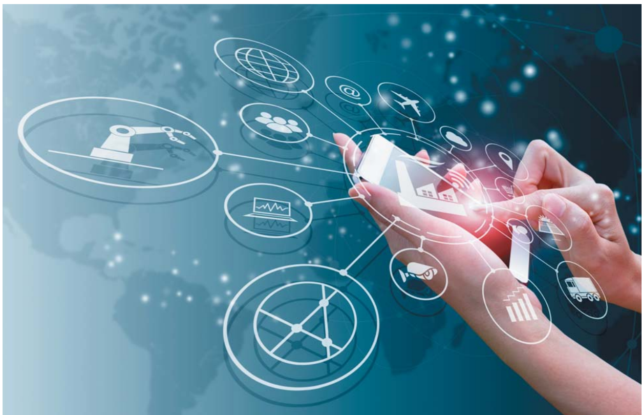
El uso de dispositivos móviles será clave para la transformación digital.

Debido a la pandemia se han decretado medidas de confinamiento general, lo que ha implicado que un alto porcentaje de la industria se detenga, incluida la industria cementera. Multitud de países tienen sus plantas completamente paradas, algunas han aprovechado para hacer un mantenimiento y operación mínima con las precauciones debidas y