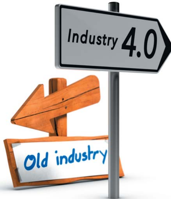
El camino a seguir nos lleva hacia la 'Industria 4.0'.

Esta es un área muy importante, con la gran transformación que se avecina con el 5G e internet de las cosas, las empresas deben prepararse desde hoy para ser competitivas mañana.